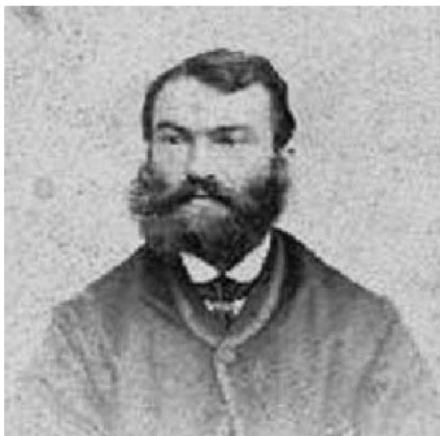
Figura 1. James Parkinson nació el 11 de abril de 1755 en Londres, Inglaterra, falleció el 21 de diciembre de 1824.

dencia de su publicación, de hecho, en el prólogo de su ensayo reconocía que publicaba sólo “sugerencias precipitadas” y que había utilizado conjeturas en lugar de una investigación exhaustiva, y también aceptaba que no había realizado exámenes anatómicos rigurosos. Aunque su descripción fue incompleta, su mérito fue relacionar una serie de síntomas aislados con una sola enfermedad.