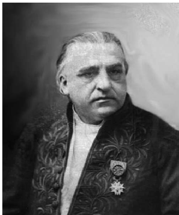
Figura 2. Jean Martin Charcot (1825-1893). Célebre neurólogo francés, conocido por sus experimentos públicos sobre el hipnotismo para tratar los ataques de histeria.

La importancia económica de este padecimiento es contundente, el gasto en Estados Unidos oscila